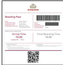
ボーディングパスイメージ

完了後、ボーディングパスをダウンロードし、ご乗船当日にご持参ください。（プリントアウトまたはデータ）