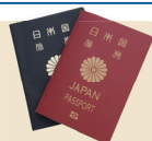
パスポート(イメージ)

※有効期限切れ、更新手続き済み等の古いパスポートを間違えて持参するケースがありますので、十分ご注意ください。